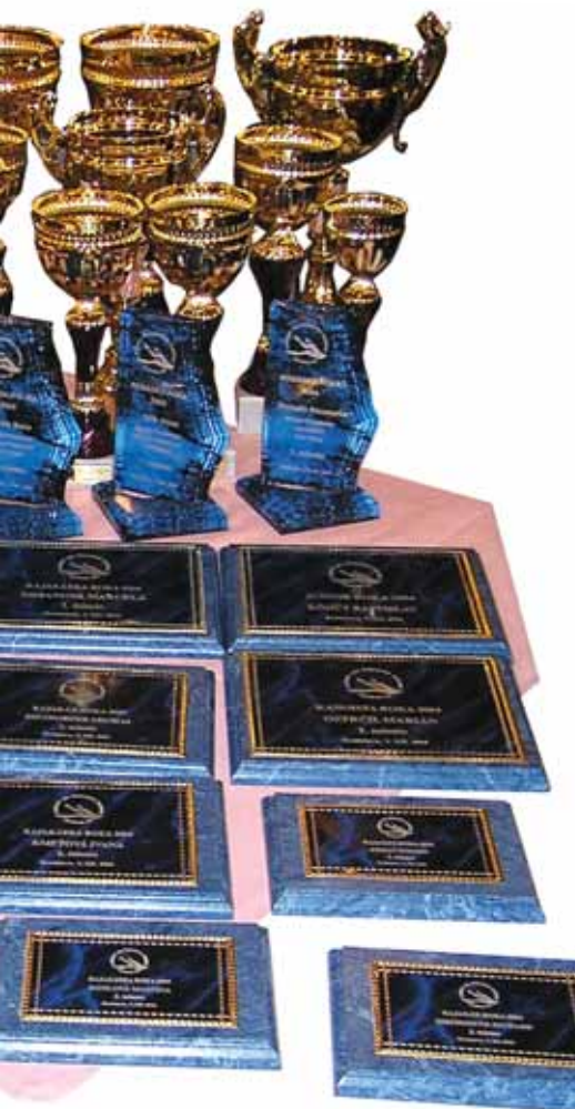
are pre víťazov Orange Slovenský pohár, ktorý sa